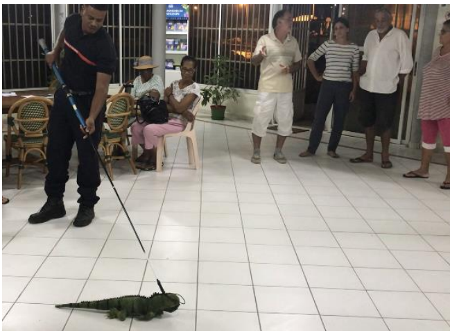
Formation du 18/12/19

Dans ce cadre, deux sessions de formation à la reconnaissance et à la capture au lasso et à la main d'iguane commun ont été organisées les 18/12/19 et 28/02/20. 16 participants ont ainsi pu être initiés à ces manipulations. C'est ce vivier qui devrait constituer les bénévoles actifs de Désirade.