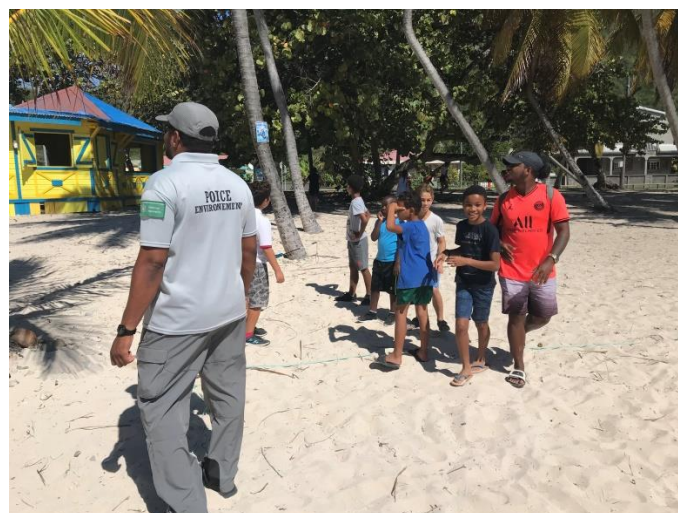
Animation OMCS du 28/01/20