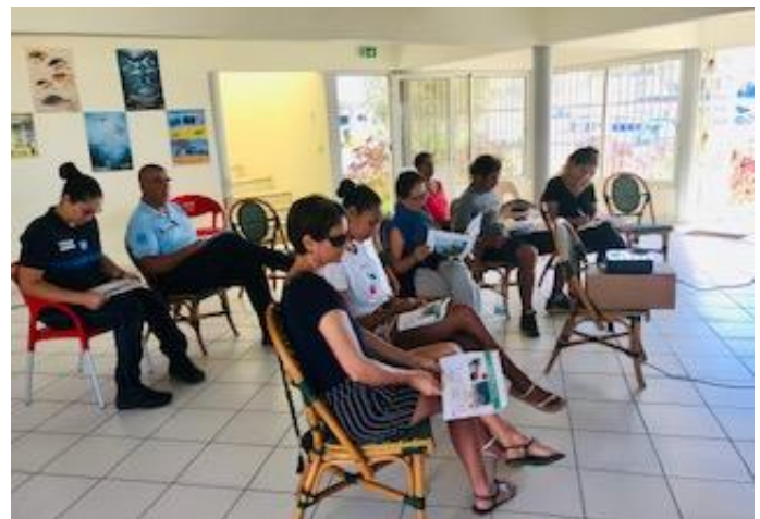
Formation du 28/02/20

Pour maintenir l'intérêt de ces premiers stagiaires, plusieurs actions sont programmées pour 2020 :